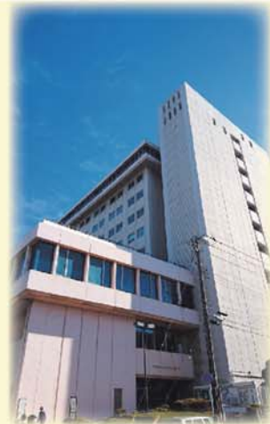
中央コミュニティセンター

建物が老朽化し、経済的な耐用年限が近づいているなど、将来的なあり方を検討すべき時期が来ています。また、建物遊休化、区分所有者による買取請求などの将来リスクの可能性がある中で、区分所有・借地権を解消することで、将来的な利活用が主体的に進めることができます。