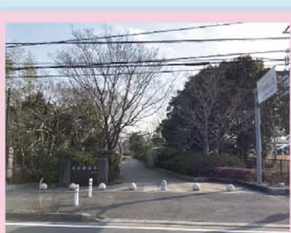
丹後堰公園の入り口

丹 後堰公園は、江戸時代、干ばつに苦しむ農民のために私財を投じて用水路を建設した、布施丹後守常長(ふせ たんごのかみ つねなが)の功績に由来する、都川の貴重な自然を保存した公園です。