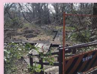
利用停止のボードウォーク

地域の公園利用者からは、「立ち入り禁止のままで、しばらく時間がたっているよ」と、ボードウォークの交換を求める声を頂いています。