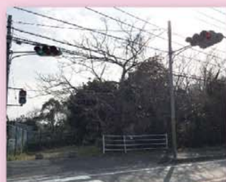
整備が不十分な接道部その1