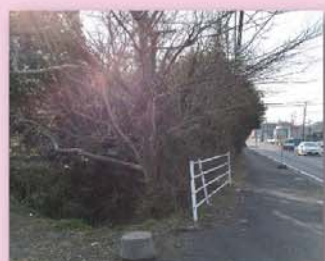
整備が不十分な接道部その2