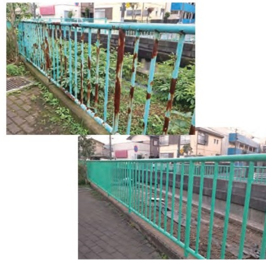
仁戸名小学校 西側法面